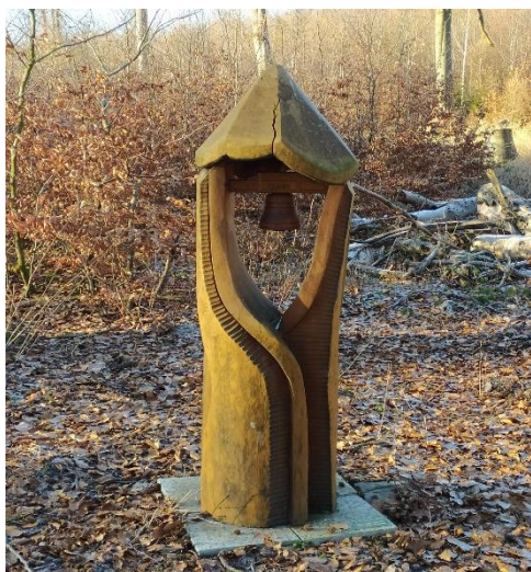
Zvon pod vrcholem Zvonu

Zvuk z tohoto strašidelného zvonu prý lze i dnes občas zaslechnout.