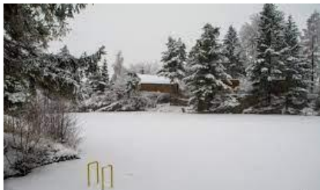
Dalovské jezírko 4.11.2022

Jezírko najdete jižně od obce Dalov ve starém břidlicovém lomu. V létě nabízí parádní pokoupaní mezi lekníny a užovkami. Jezírko leží v nadmořské výšce 601 m.