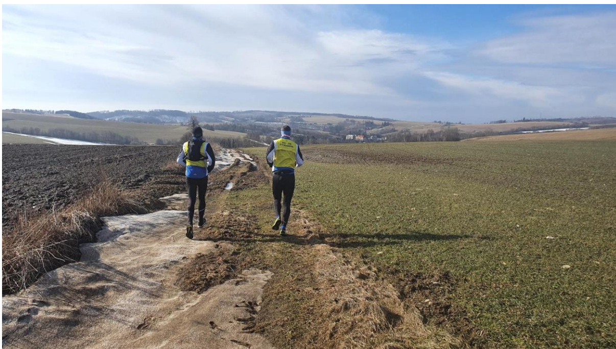
Nejmenovaní členové SKI-OB Šternberk ilegálně přebíhají hranice katastru Šternberka a míří na ČS PHM v Nových Dvorcích

Památné místo, kde se v době covidových restrikcí (a zavřené kavárny V parku) ilegálně sbíhali nejmenovaní členové SKI-OB Šternberk, aby si na chodbičce 2 x 1 m před společnou toaletou dali několik plechovkových plzniček.