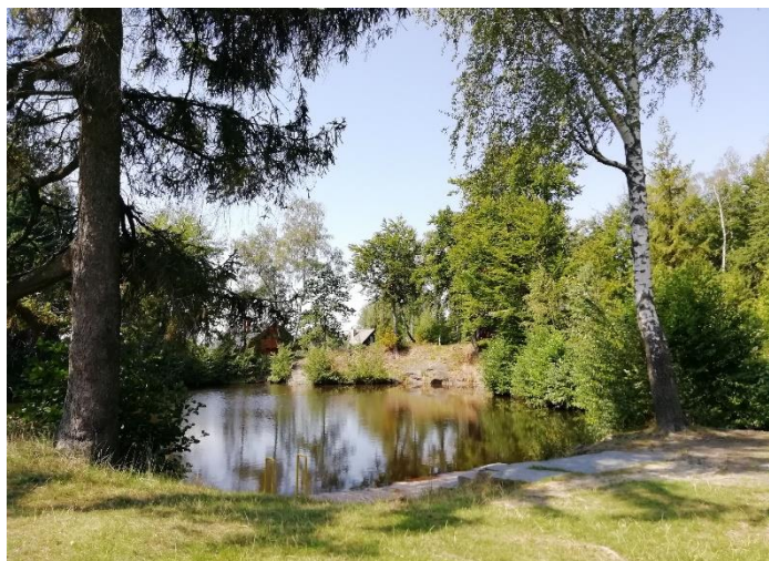
Dalovské jezírko v létě