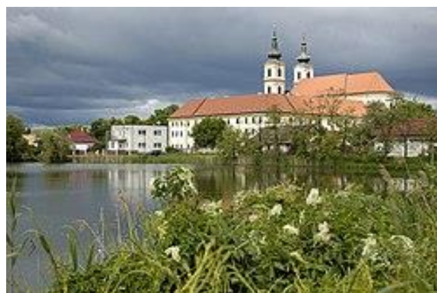
Kláster paulánů a bazilika Panny Marie Sedmiboletné

Nejvyšší nadmořská výška je ve Strážích 256 m n. m., nejnižší v Myjavské nivě, 165–170 m n. m. V Šaštíně směrem na jih nadmořské výšky kolísají od 183 m n. m. do 205 m n. m.